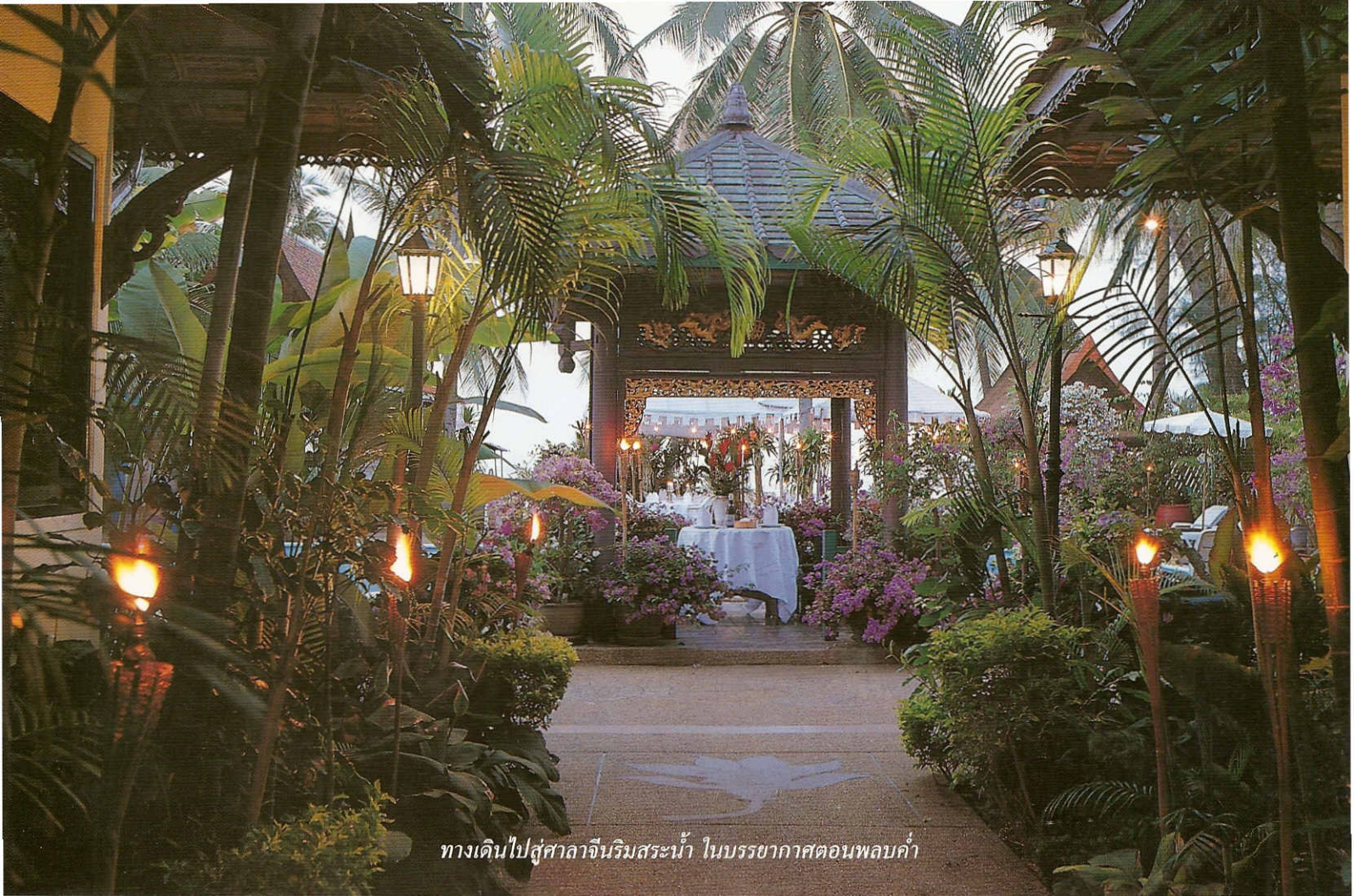
ทางเดินไปสู่ศาลาจีนริมสระน้ำ ในบรรยากาศตอนพลบค่ำ