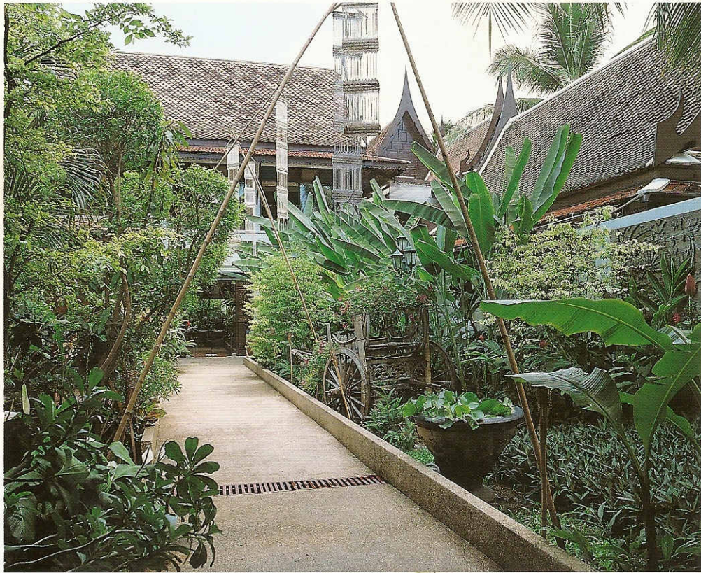
โรงแรมในลักษณะรีสอร์ท ที่จัดสร้างตัวอาคารต่างๆ เหมือนเป็นหมู่บ้านไทยทางภาคกลาง สองข้างทางเดินที่นำไปสู่เรือนใหญ่อันประกอบด้วย โถงต้อนรับ ล็อบบี้ ห้องอาหาร เน้นขนาดไปด้วยต้นไม้เขตร้อนชื้น เช่น โมก กล้ายบัว คล้า จิง ฯลฯ