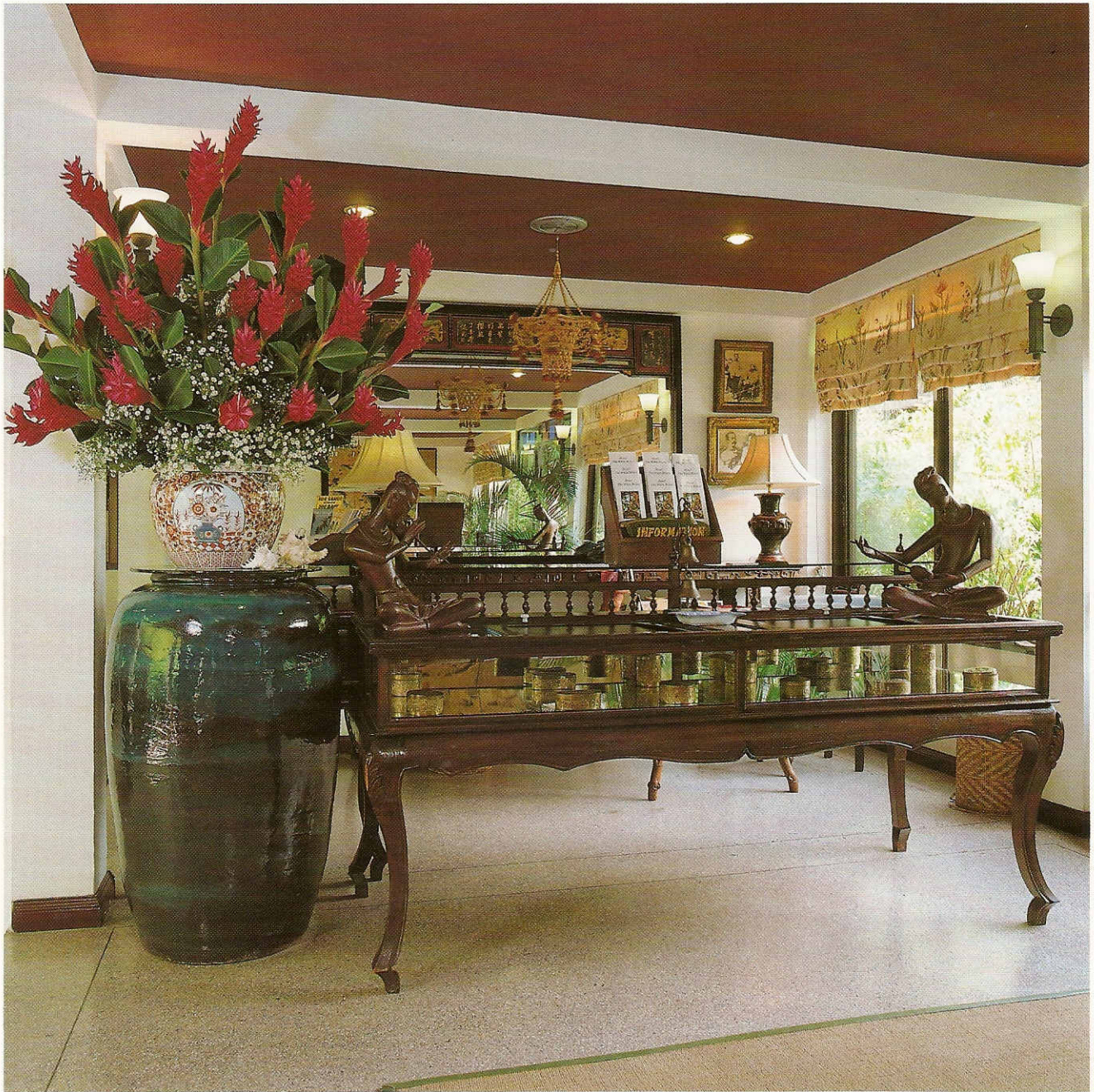
โถงต้อนรับไม่เน้นความอลังการ แต่สร้างบรรยากาศภูมิฐาน ด้วยเครื่องเรือนของตกแต่งแบบเก่าของเอเชีย

Hotel The White House มีลักษณะเหมือนเป็นหมู่บ้านไทยสมัยก่อน เพราะมองไปทางไหนก็เห็นแต่ยอดหลังคาทรงจั่วกับสวนที่จัดปลูกต้นไม้พันธุ์ ไร่กระเทียมเหมือนไม้ตั้งใจแบบอารมณ์คนไทย คือตรงไหนมีพื้นที่ว่างนั้นก็ปลูกต้นไม้ที่มีประโยชน์ไม่ว่าจะ