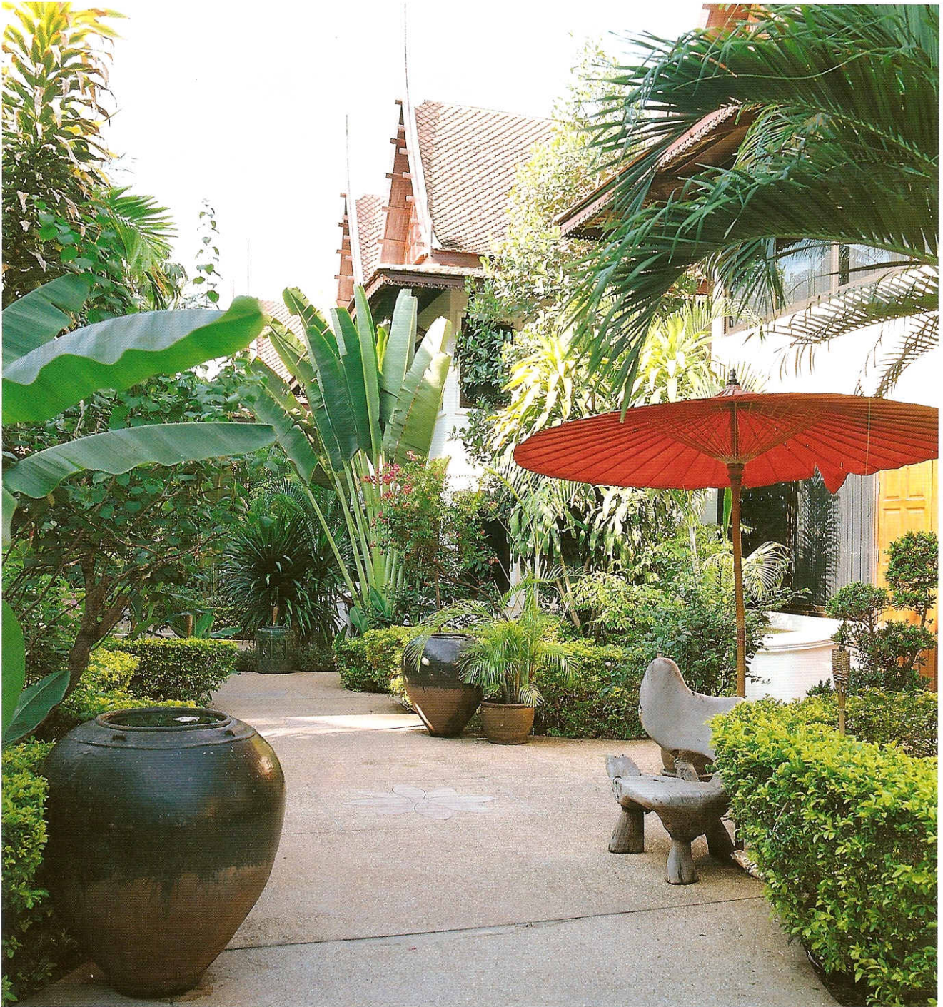
มุมมองด้านหน้าเรือนพักได้ร่มแบบพื้นเมืองคันโตกลมกลืนกับสภาพแวดล้อม

สมัยก่อนถ้าพูดถึงเกาะสมุย เราก็ต้องนึกถึงมะพร้าวกับเจ้าวานรยอดนักปืนเป็นอันดับแรก เพราะมันเป็นเกาะที่ได้ชื่อว่ามีต้นมะพร้าวมากที่สุดในเอเชียตะวันออกเฉียงใต้ อยู่ในอ่าวไทย ห่างจากกรุงเทพฯ ไปทางตอนใต้ประมาณ 600 กิโลเมตร