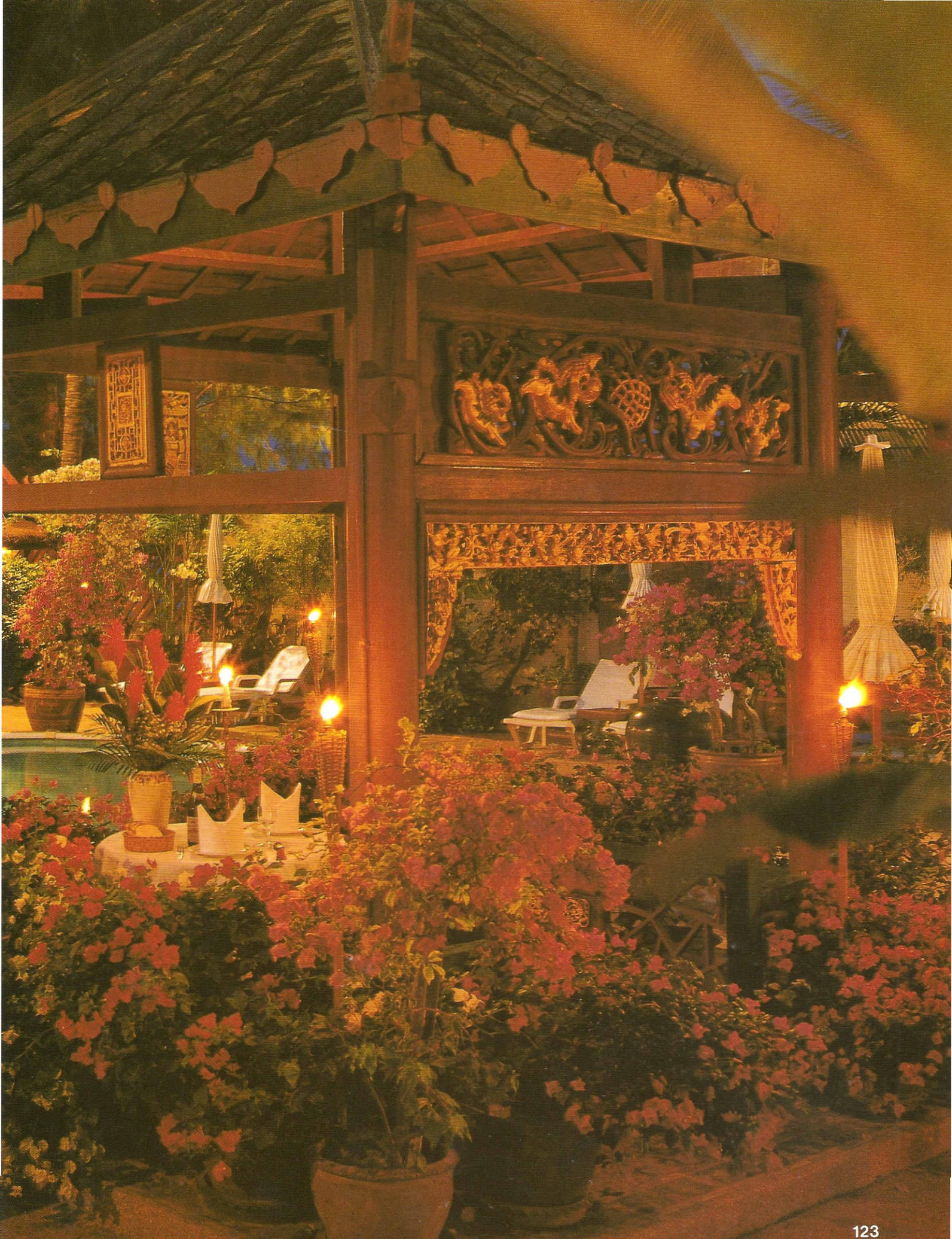
พอดค่ำก็ได้ลิ้มรสกับอาหารนานาชาติ และซีฟู้ด ท่ามกลางบรรยากาศสวนฝิ่นที่มุมออกรับ