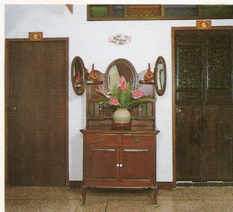
บริเวณหน้าห้องน้ำส่วนลิโอบบี้ มีตู้ไม้แบบเก่าใบเดียวกั้นกลาง ระหว่างห้องน้ำชายกับห้องน้ำหญิง

ห้องพักจำนวน 40 ห้องของ โรงแรม ประกอบด้วย ห้องซูพีเรียร์ 16 ห้อง เดอลักซ์ 16 ห้อง และจู- เนียร์สวีท 8 ห้อง ภายในติดตั้งเครื่อง มือเครื่องใช้สำหรับอำนวยความสะดวก ต่างๆ เช่น เครื่องปรับอากาศ พัดลม- เพดาน โทรศัพท์ โทรทัศน์ ตู้นิกซ์ และมินิบาร์พร้อมอุปกรณ์ทำเครื่องดื่ม ประเภทชา กาแฟไว้พร้อม