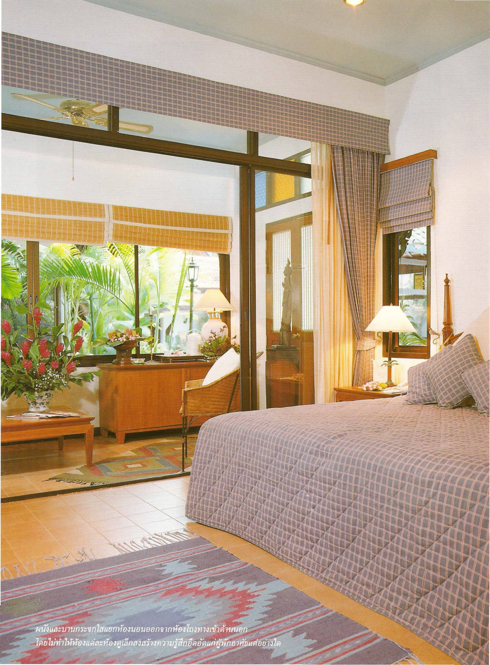
ผนังและบานกระจกใสแยกห้องนอนออกจากห้องโถงทางเข้าด้านนอก โดยไม่ทำให้ห้องแต่ละห้องดูเล็กลงสร้างความรู้สึกอึดอัดแก่ผู้พักอาศัยแต่อย่างใด