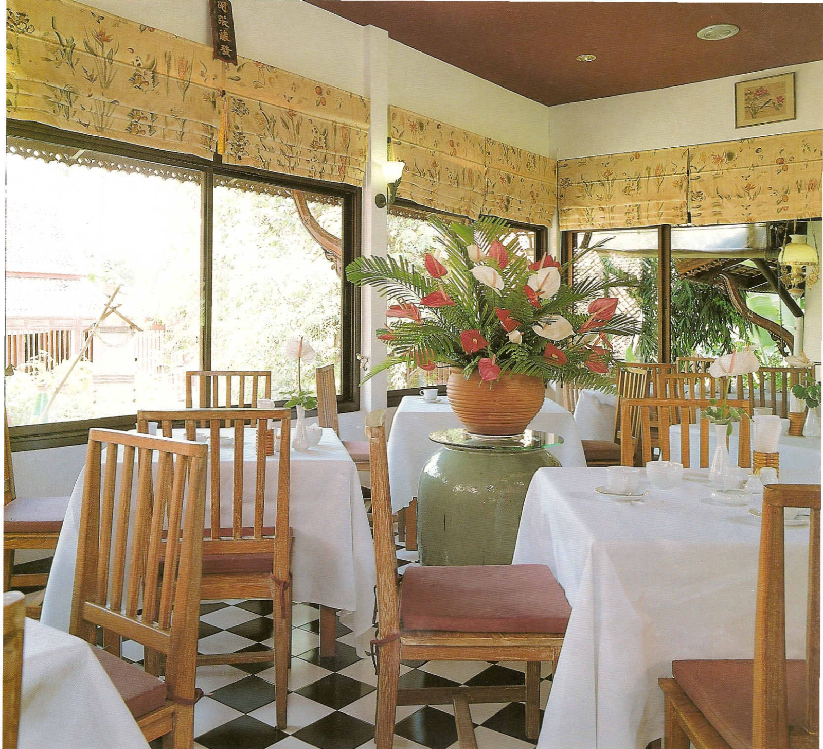
ห้องอาหารสี่ฤดู (Four Seasons Restaurant)