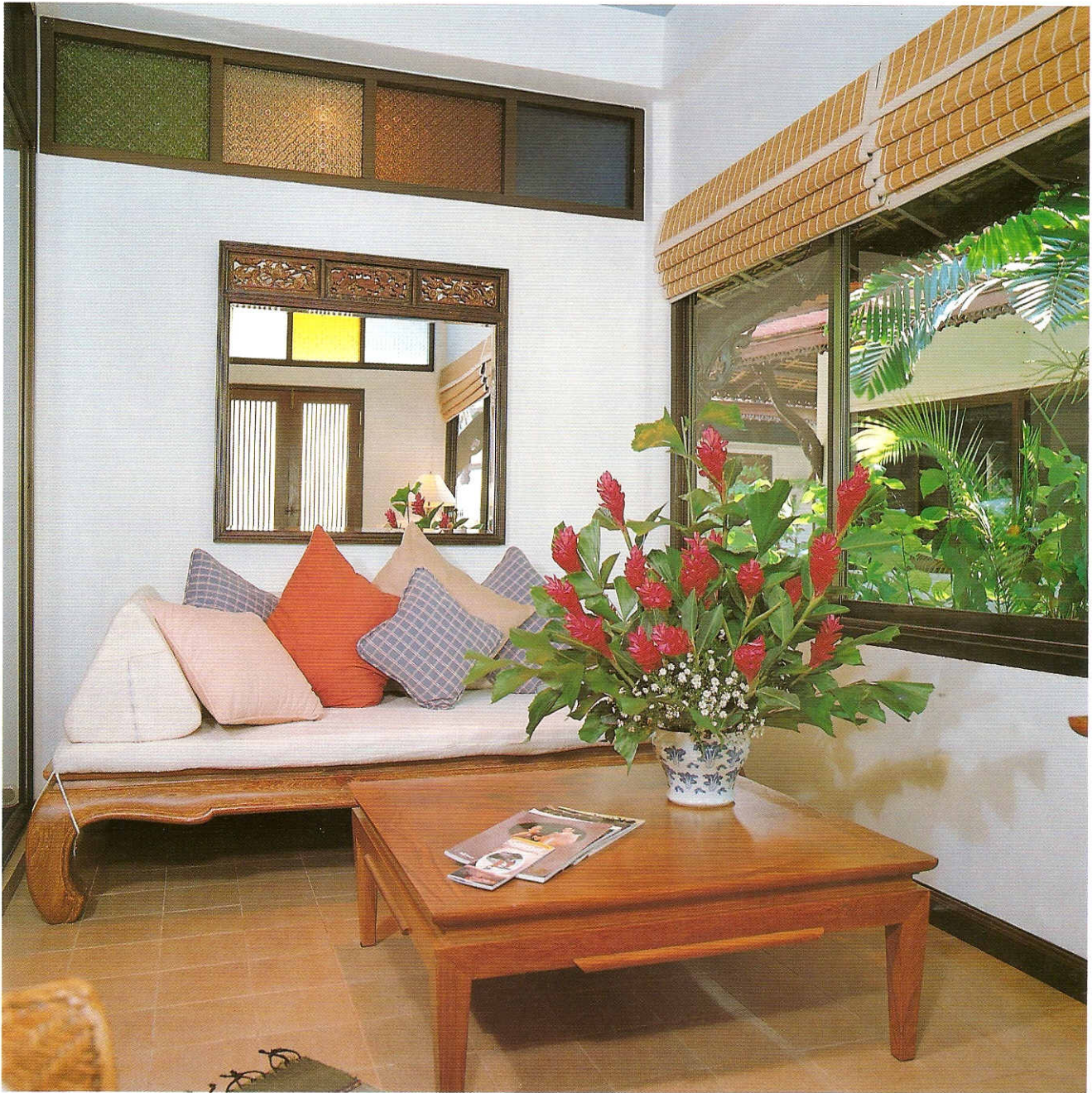
มุมนั่งเล่นชมวิวหน้าห้องนอน มีต้นไม้ภายนอกช่วยบังสายตาคนภายนอกไว้ชั้นหนึ่งในกรณีที่ไม่ต้องการปิดม่านไม้ไผ่

บานประตูห้องนอนเป็นบานเลื่อนกระจกใส สามารถมองผ่านออกไปชื่นชมความงดงามภายนอกได้อย่างเต็มที่ ภาพประดับผนังคือตัวสร้างสีสันให้กับบรรยากาศภายในห้องด้วยสไตล์ของภาพที่เป็นแบบโมเดิร์น แต่ก็ยังเป็นภาพจีนเพื่อให้เข้ากับแนวทางการตกแต่งโดยรวมของห้อง