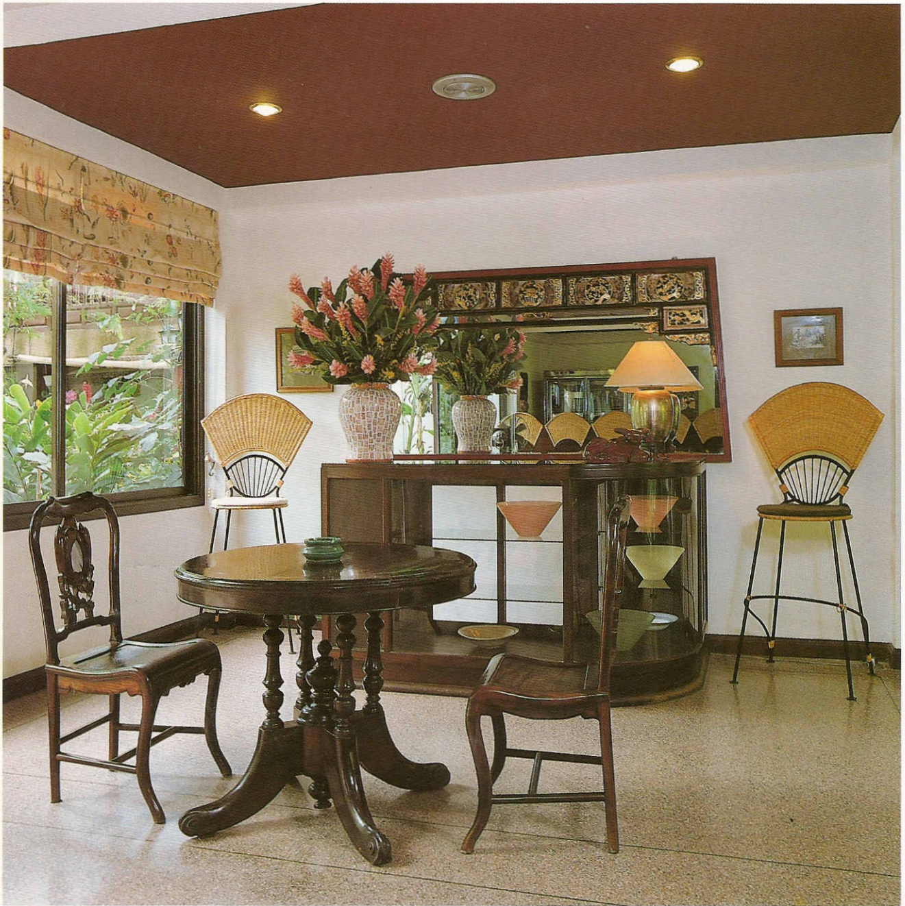
บริเวณลิโอบบี้บาร์ เพื่อการนั่งดื่ม

ห้องพักจำนวน 40 ห้องของ โรงแรม ประกอบด้วย ห้องซูพีเรียร์ 16 ห้อง เดอลักซ์ 16 ห้อง และจู- เนียร์สวีท 8 ห้อง ภายในติดตั้งเครื่อง มือเครื่องใช้สำหรับอำนวยความสะดวก ต่างๆ เช่น เครื่องปรับอากาศ พัดลม- เพดาน โทรศัพท์ โทรทัศน์ ตู้นิกซ์ และมินิบาร์พร้อมอุปกรณ์ทำเครื่องดื่ม ประเภทชา กาแฟไว้พร้อม