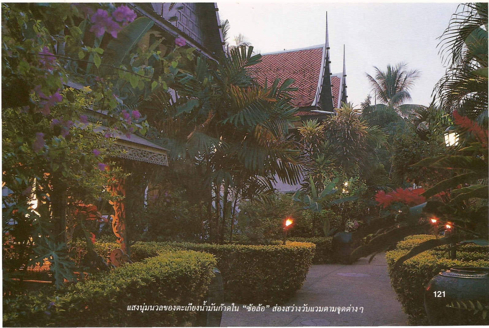
แสงนุ่มนวลของตะเกียงน้ำมันก๊าดใน “ซ้อล้อ” ส่องสว่างแวบแวนตามจุดต่างๆ