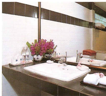
ห้องน้ำใช้วัสดุสมัยใหม่แต่เลือกคู่มือคลาสสิกดำ-ขาว เพื่อไม่ให้ขัดกับบรรยากาศภายนอกเกินไป

บานประตูห้องนอนเป็นบานเลื่อนกระจกใส สามารถมองผ่านออกไปชื่นชมความงดงามภายนอกได้อย่างเต็มที่ ภาพประดับผนังคือตัวสร้างสีสันให้กับบรรยากาศภายในห้องด้วยสไตล์ของภาพที่เป็นแบบโมเดิร์น แต่ก็ยังเป็นภาพจีนเพื่อให้เข้ากับแนวทางการตกแต่งโดยรวมของห้อง